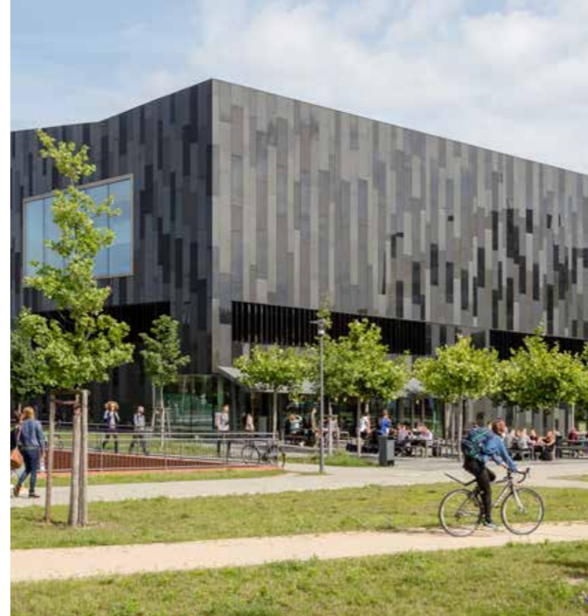
Universität Potsdam Campus Golm im Wissenschaftspark Potsdam-Golm

Der Technology Campus im Wissenschaftspark Potsdam-Golm bietet ab sofort rund 10 Hektar Fläche für hochwertige technologie- und forschungsorientierte Gewerbenutzungen, Produktionsstandorte und Dienstleistungen.