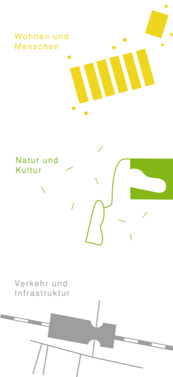
Auf dieser Fläche entsteht ab 2018 das neue GO:IN 2

Vor Ort gibt es außerdem ein gutes und kontinuierlich wachsendes Angebot an Nahversorgung und sozialer Infrastruktur sowie bilinguale Kinderbetreuung.