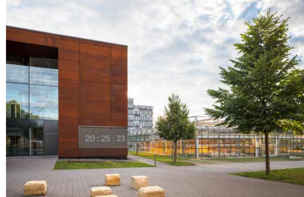
Universität Potsdam, Campus Golm